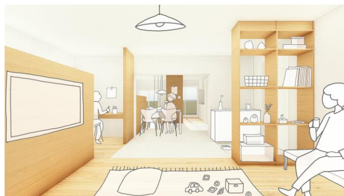
Bタイプ (2LDK) イメージ図